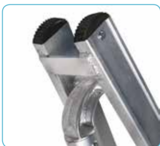
• Cerniera in alluminio