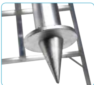
• Puntale in fusione alluminio