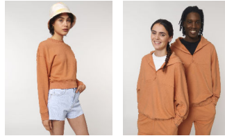
Stella Cropster Wave Terry Globetrotter Wave Terry

Shell : Seersucker Terry , 100% cotone biologico filato e pettinato , Visiera washed , 350 GSM